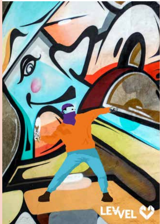
Beeld: gemaakt door Aaron Kasanmoerawi (18 jaar)

Heb je vragen of wil jij je aanmelden? Dat kan tot uiterlijk 15 juli! Mail dan naar: j.peeters@level.nl